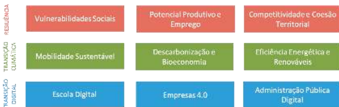
Nove roteiros para a retoma do crescimento sustentável e inclusivo

para assegurar que Portugal acelera a transição para uma economia e sociedade mais digitalizadas, no âmbito deste Plano as opções nacionais assentam em três prioridades, traduzidas nos seguintes roteiros: a digitalização da escola; a digitalização das empresas; e a digitalização da administração pública.