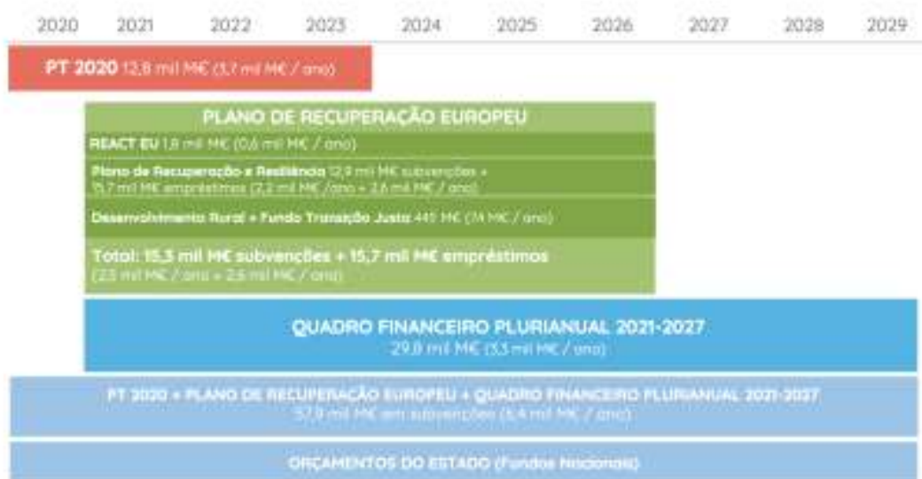
Os instrumentos financeiros disponíveis no período 2020-2029

Por fim, importa referir que decorre ainda até 2023 a execução do Acordo de Parceria Portugal 2020, para o período 2014-2020 e que está em vias de ser reforçado com recursos vindo do REACT-EU, criado no quadro no do instrumento de recuperação europeu Next Generation EU , pelo que são vários os instrumentos financeiros que se articulam e complementam.