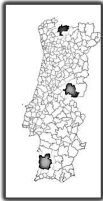
Quadro 19 - Municípios alvo de avaliação do desenvolvimento local (Montalegre, Castelo Branco e Odemira)