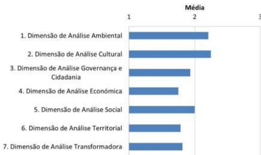
Figura 1 - Dimensões da Escala de Avaliação do Desenvolvimento Local